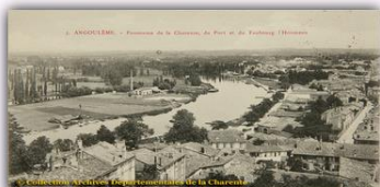
Le faubourg de l'Hommeau, vu du plateau

Naturellement les tanneries, les blanchisseries, tous les commerces aquatiques restèrent à la portée de la Charente; puis les magasins d'eaux-de-vie, les dépôts de toutes les matières premières voiturées par la rivière, enfin tout le transit borda la Charente de ses établissements.